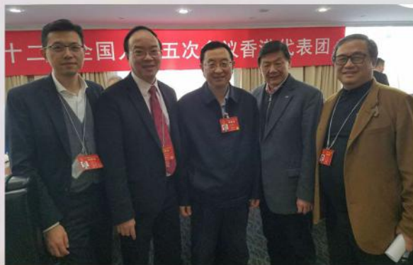
2017年3月2日(星期二) 兩會期間，國家文化部長雒樹剛先生看望港區代表團。胡曉明會長提到了商會今年的幾項重點活動，得到了一致好評和支持。