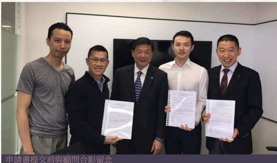
申請書提交前與顧問合影留念

香港山西商會於2017年3月23日正式提交了第五期歷史建築活化計劃的申請，將前英軍軍營「羅拔時樓」改建為「桐荊文化會館」。