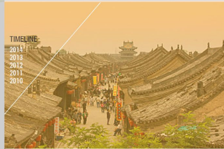
TIMELINE 2014 2013 2012 2011 2010