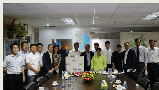
胡志明房地產前景良好

→ 胡志明市房地產協會座談，座談就胡志明市房地產產業進行了深入的交流，從越南人口結構，消費習慣，文化等方面具體分析了影響房地產市場的各個因素，胡會長指出，投資房地產要立足市場調研的工作，對比香港與越南房地產市場的差異性，把香港管理及制度方面的優勢帶到越南。