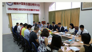
越南中國商會胡志明市分會，介紹了胡志明市近年來各行業的發展情況。