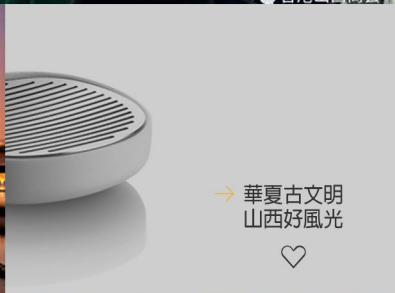
→ 華夏古文明 山西好風光