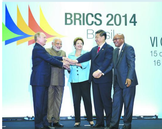
國家領導人習近平在巴西出席金磚國家領導人峰會