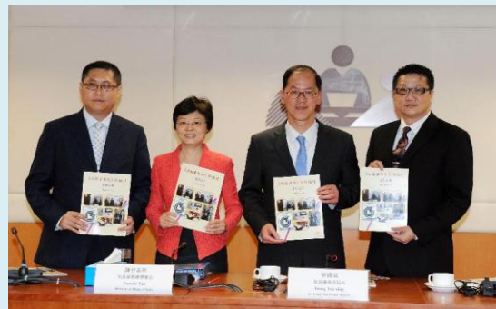
政府就《旅館業條例》的檢討展開公眾諮詢。圖示(左起)：民政事務總署助理署長郭偉勳、民政事務總署署長陳甘美華、民政事務局局長曾德成及民政事務總署副署長陳積志。