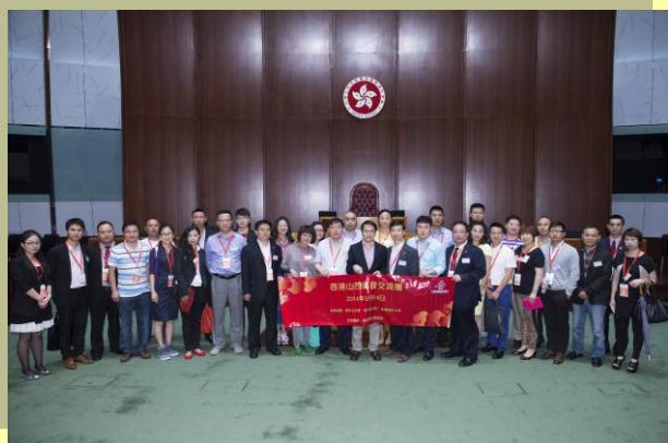
成員與立法會議員陳克勤先生合影

為讓山西成員更了解香港的情況，商會特別組織是次交流活動，帶領 30 多名山西朋友參觀立法會大樓、與陳克勤議員交流、參觀香港聯合交易所、邀請香港貿易發展局代表與香港城市大學代表舉行座談會，以及參觀香港城市大學多媒體學院。