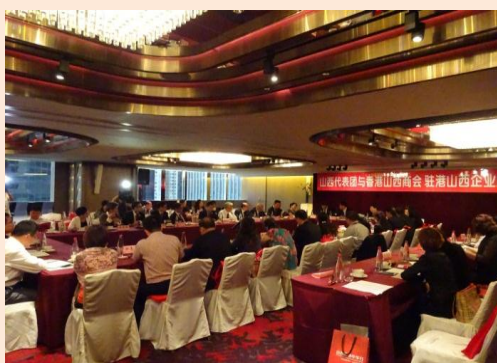
商會成員出席山西省商務廳座談會