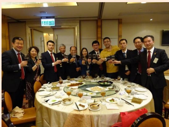
商會會員與企業代表一起舉杯合影