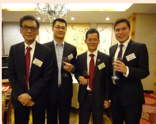
商會成員與來賓合影