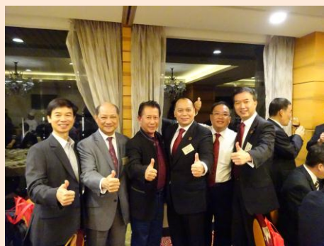
商會成員與嘉賓美國中菜名廚甄文達先生合影