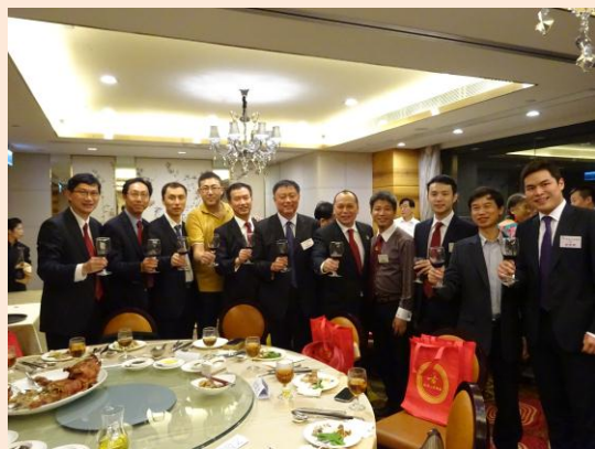
商會成員與山西省商務廳廳長孫躍進先生祝酒