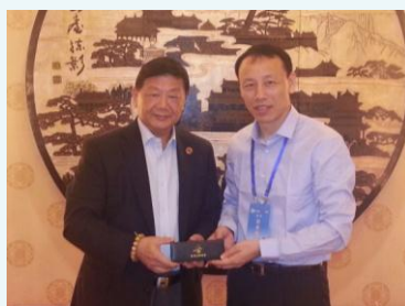
胡曉明會長贈紀念品予統戰部副部長郭海剛