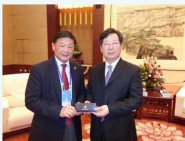
胡曉明會長贈紀念品予山西省委副書記樓陽生