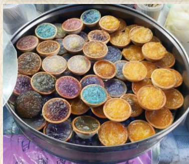
島上有小點售賣的鯔仔糕