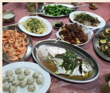
島上的客家海鮮值得品嚐，都很新鮮