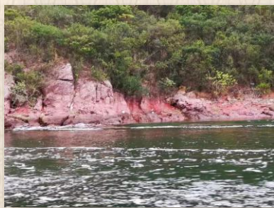
紅石門，這海域的石都是紅色的，而這海口石頭是特別的紅，因而稱為紅石門

吉澳、荔枝窩、鴨洲：香港聯合國教科文組織世界地質公園-新界東北沉積岩園區。 乘搭小艇出海，遊覽紅石門、印洲塘等。