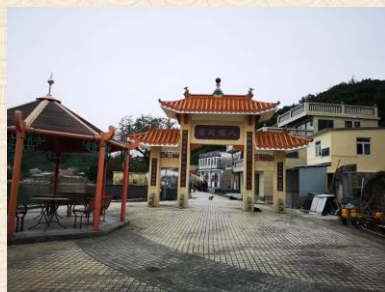
吉澳擁有近300年歷史，民風淳樸，適合用舌尖、足尖發覺漁村之美。