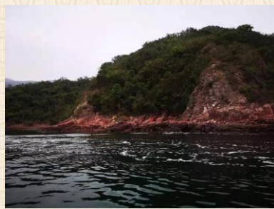
全面被小島包圍的海域，波平如鏡。英國皇室來港渡假，也選擇在這區遊覽，在船上過夜。