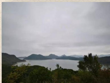
沙頭角外的印洲塘，擁有海灣、突出的陸岬、半島、石崖、沙咀等多種地貌，有「香港小桂林」美譽。